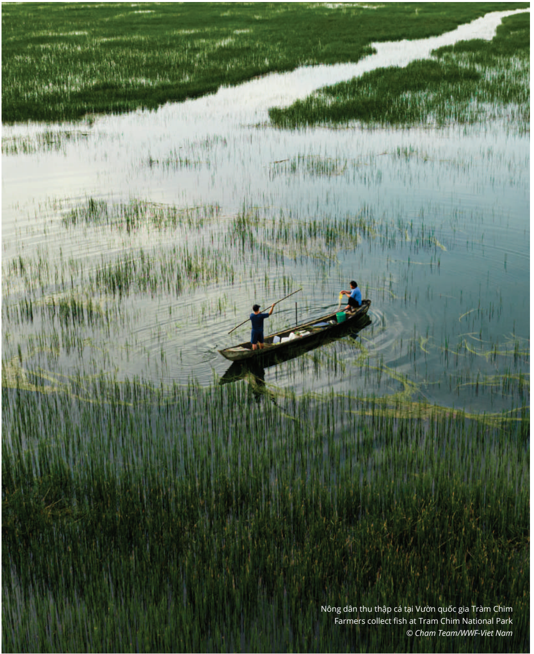
Nông dân thu thập cá tại Vườn quốc gia Tràm Chim Farmers collect fish at Tram Chim National Park